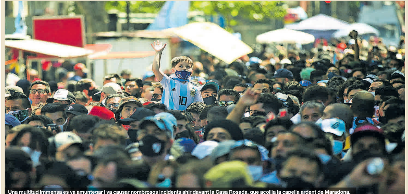
Una multitud immensa es va amuntegar i va causar nombrosos incidents ahir davant la Casa Rosada, que acollia la capella ardent de Maradona.

UNA MAREA HUMANA ACOMIADA L'ASTRE A L'ARGENTINA || TEMA DEL DIA ▶ 2 a 8