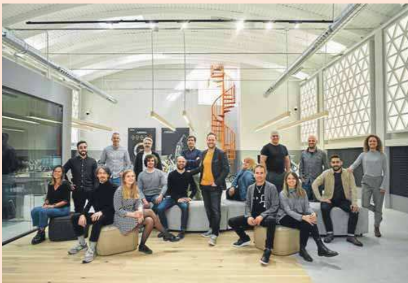
Imatge de l'equip d'Anima Design, a la nova seu de l'empresa. ARXIU